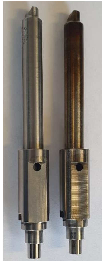
以上图片显示的 2 中 SIP 阀的油嘴。左侧为正品，右侧为假冒产品。所有新的正品均有清晰的标识，从而容易被识别。