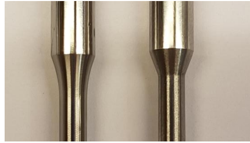
Figure 3. 近距离观察，原装针阀在半径上的减少比较平缓。 右侧是假冒的针阀