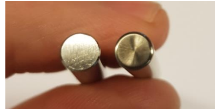
Figure 4. 近距离观察，原装备件从侧面到顶部的过渡比较尖利。 右侧是假冒的针阀