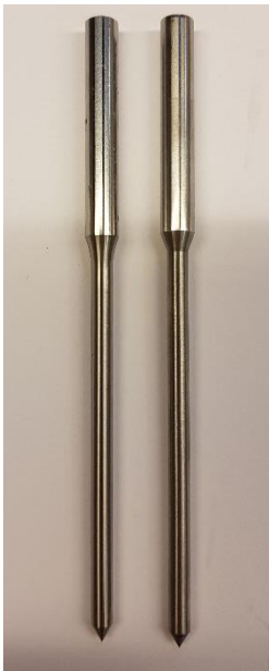
Figure 3. 原装针阀和假冒针阀。 右侧为假冒针阀

序列号作为唯一特性，能在原装的 HJL 油嘴上看到。更进一步的确认可能可以从观察油嘴座内部的针阀上辨认。