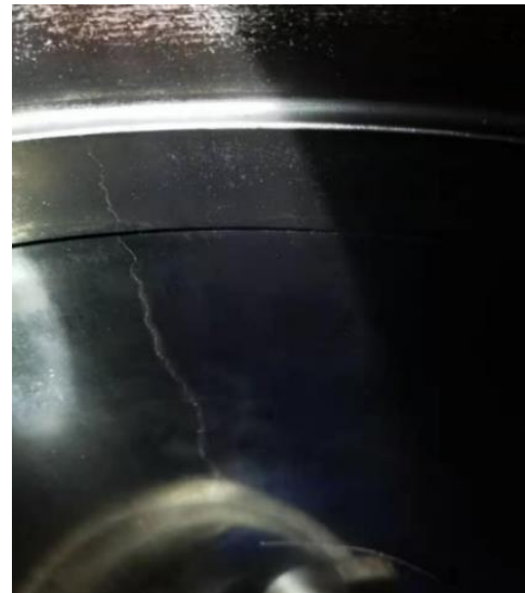
Figure 1. 破裂的缸套。 使用假冒备件及假冒服务导致的后果