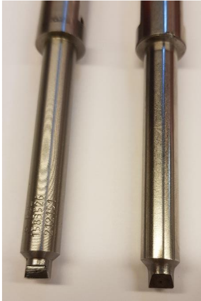
Figure 2. 假冒的油嘴可能没有序列号 上图中右侧为假冒油嘴

序列号作为唯一特性，能在原装的 HJL 油嘴上看到。更进一步的确认可能可以从观察油嘴座内部的针阀上辨认。